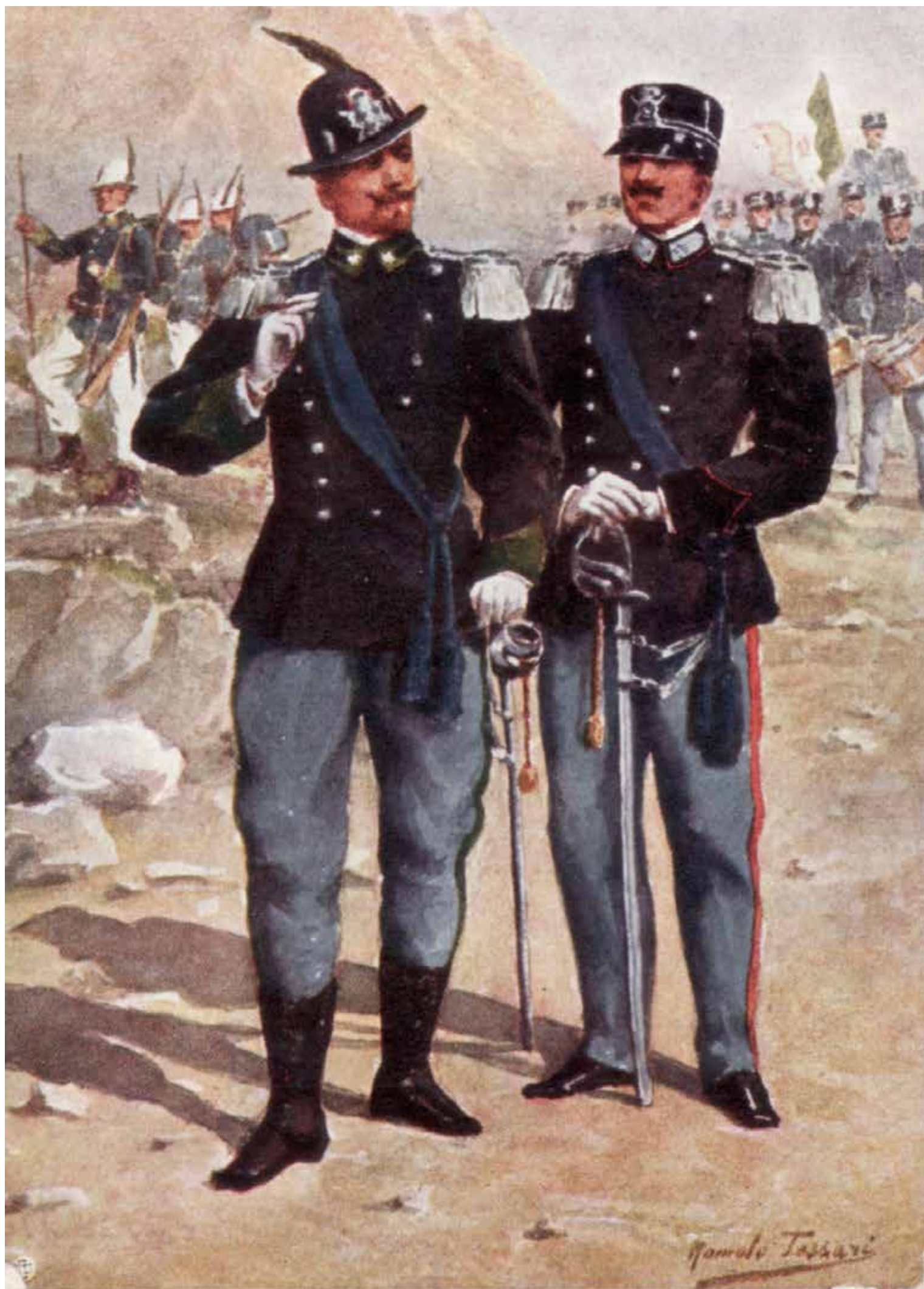
Come eravamo. Due Sottotenenti - a sinistra degli Alpini, a destra della Fanteria di Linea - nell'uniforme mod. 1903 appena adottata. Il pittore, Romolo Tessari (Castelfranco Veneto / Treviso, 4 settembre 1860 - Mira / Venezia, 14 luglio 1925), fu noto artista, ma durante la Grande Guerra, da ultracinquantenne Capitano della Riserva, meritò anche una Medaglia di Bronzo al Valor Militare a Monfalcone, il 15 maggio 1916.