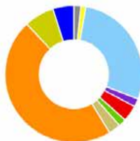
DISTRIBUZIONE DELLE ORE LAVORATE